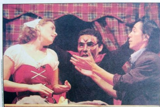
Clásica adaptación a Fausto y el diablo demostraron sus personalidades ante los asistentes de la jornada teatral.

Como se apuntaba en la introducción, la primera vertiente del concepto expresión corporal se puede ver desde un punto de vista antropológico. Esta vertiente antropológica o etológica es, simple y llanamente, la exteriorización de las emociones, es decir, del estado de ánimo producido por cualquier estímulo, tanto interno como externo, y que tiene como forma de manifestación más común el movimiento como respuesta a cualquier estímulo. No es particular del género humano, sino común a todos los animales